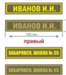
КОЖАРА парадная повседневная